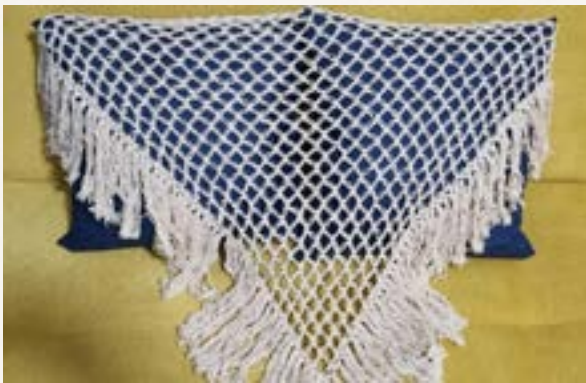
Xalé de crochê

Passa o tempo, mas o artesanato continua em nossas vivências, dá forma às culturas, perpetua momentos... Quem nunca trouxe de algum lugar “uma lembrancinha” para não esquecer ou para poder “mostrar”, relembrar momentos, vivências, sensações?! Apesar de fotos e vídeos desses momentos, o artesanato dá forma e possibilita o toque, concretiza para os sentidos o que foi vivido.