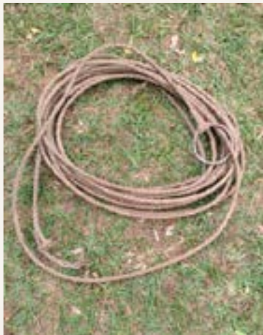
Laço fino antigo feito por guasqueiro