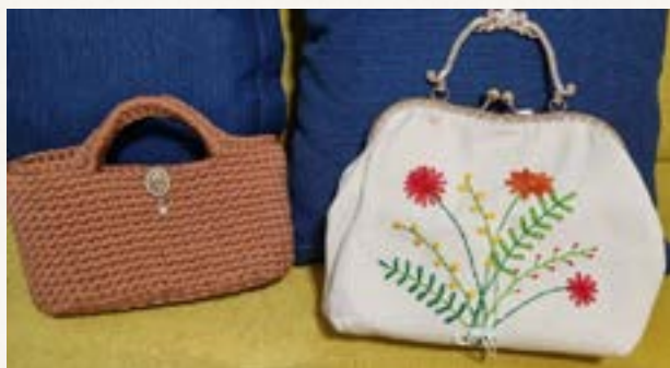
Bolsas de crochê e de algodão bordado