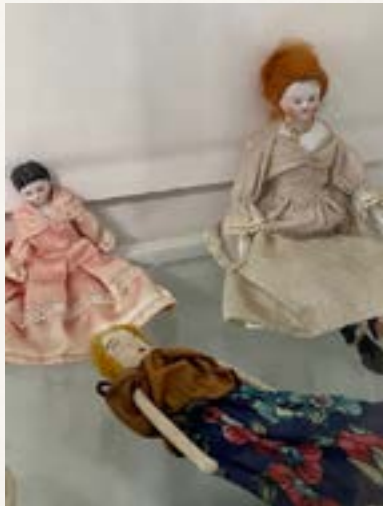
Bonecas de pano