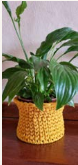
Cachepô de crochê