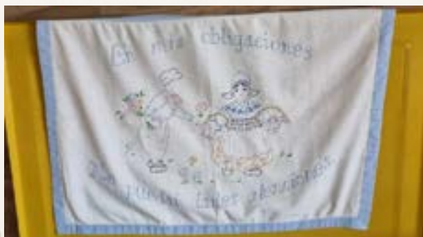
Painel de parede bordado