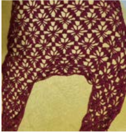
Fichu de crochê